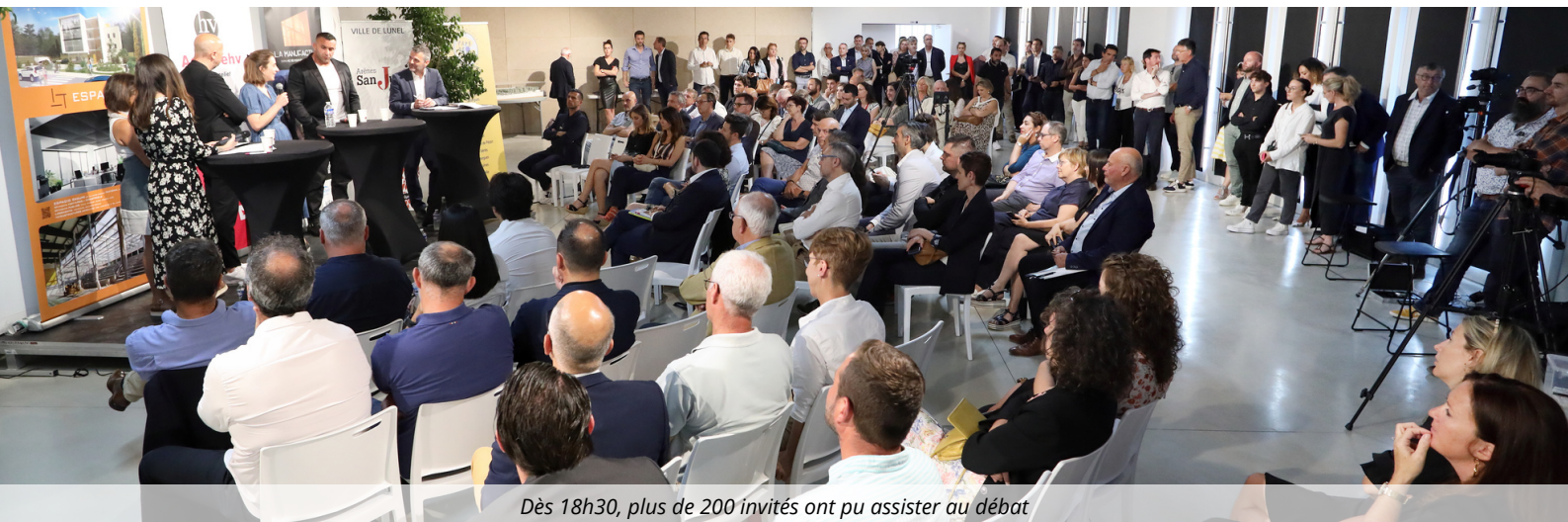
Dès 18h30, plus de 200 invités ont pu assister au débat