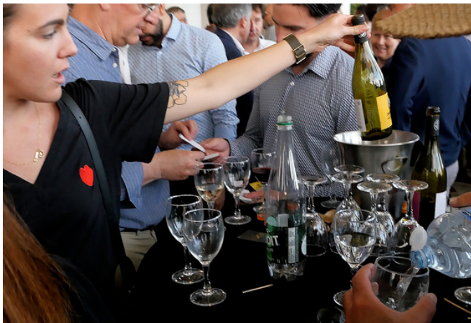
Eh mince, il n'y en a déjà plus...