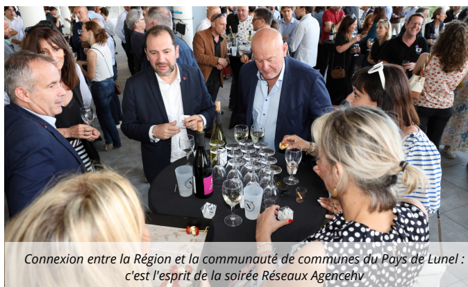
Connexion entre la Région et la communauté de communes du Pays de Lunel : c'est l'esprit de la soirée Réseaux Agencehv