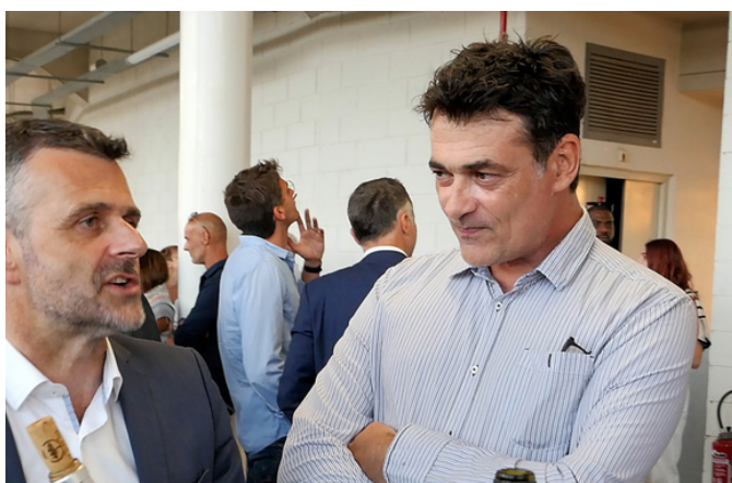
C'est quoi ton plus grand traumatisme de foot : Kostadinov 1993, Italie 2006 ou Argentine 2022 ?