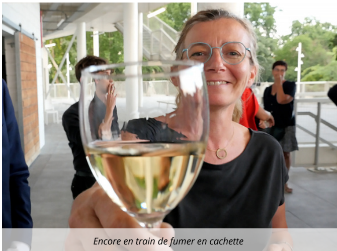
Encore en train de fumer en cachette