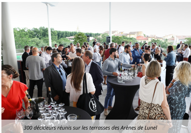
300 décideurs réunis sur les terrasses des Arènes de Lunel