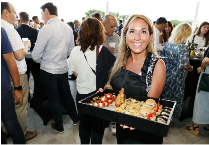
L'équipe tout sourire du traiteur