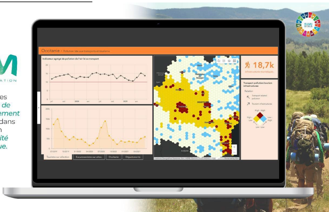
Image 1- Murmuration fournit des tableaux de bord d'aide à la décision

Intégrer les Objectifs de Développement Durable dans la gestion de l' activité touristique .